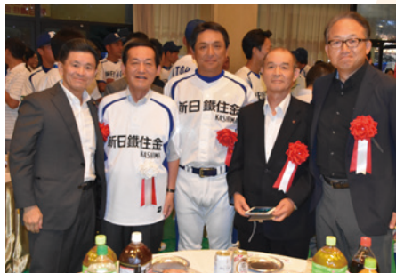
▲ 都市対抗野球全国大会・新日鐵住金鹿島の壮行会に出席。3年連続18回目の出場です。