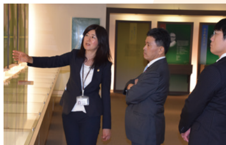
▲ 医療用漢方製剤の工場として世界一の規模と生産能力を誇る(株)ツムラ茨城工場・研究所見学。