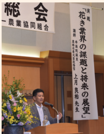
花き業界の課題と将来について講演。