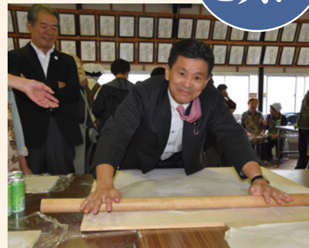
▲ 常陸秋蕎麦のそば打ちのお手伝い中。