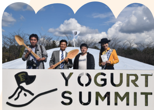
▲ 酪農活性化を目指し、小美玉市の若手職員が提案し、準備期間9か月を経て開催された第1回ヨーグルトサミット。「ヨ」の文字が青空に映えますね。