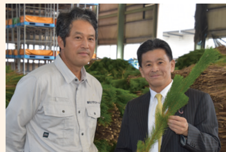
▲ お正月飾りの松の収穫・選果の工場です。10月半ばですが既に新年の準備が始まっています!