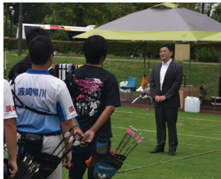
▲ 全日本アーチェリー連盟副会長を務めています。来年の国体、頑張ってください!!