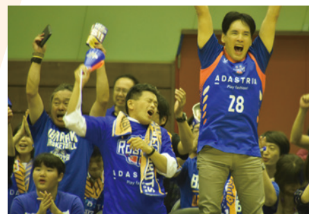
▲ 茨城ロボッツ開幕戦、1点差で劇的勝利! 思わずガッツポーズ。